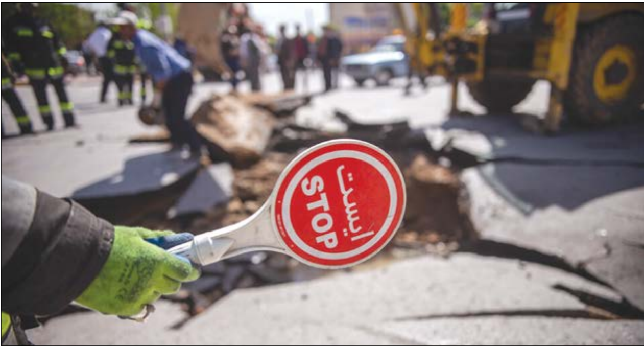
گروه یازگانه هفته نامه نوسان

میزان فروتنست در اصفهان به ۱۶.۵ سانتیمتر در سال رسیده است