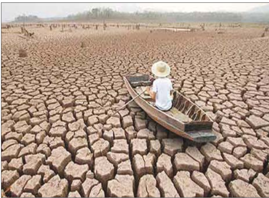
گروه اجتماعی مقده نلم نوسان

مهاجرت کشاورزانی که دیگر به منابع آبی دسترسی ندارند، اعتراض‌های اجتماعی جمعیت آسیب‌دیده را به دنبال دارد