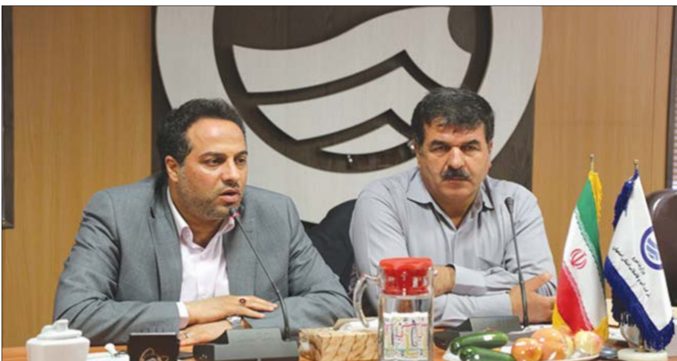
گروه شهری گزارش

امینی: میزان آب بدون در آمد اصفهان ۱۶ درصد است