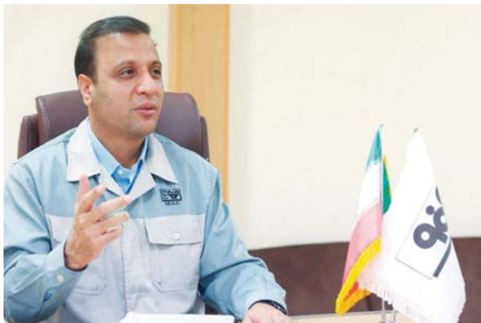
گروه صنعت گفت و گو

رشد ۱۳۰ درصدی سود خالص فولاد مبارکه نوید بخش سالی پر سود برای سهامداران است