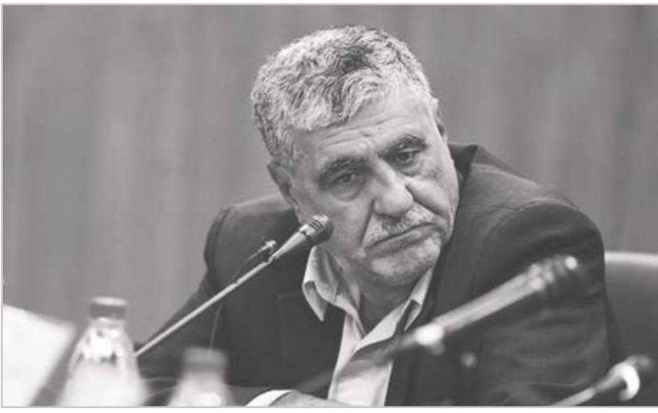
گروه شهری گفت و گو مدانای چرخ ششگانه روزنامه نگار