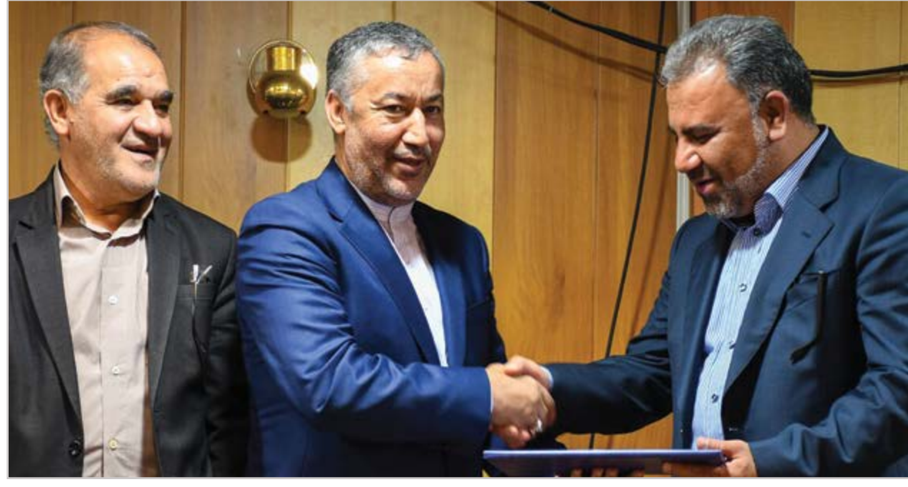
گروه شهری گزارش

با احداث شهرک پوشاک ۱۲۰ هزار شغل به صورت مستقیم ایجاد خواهد شد