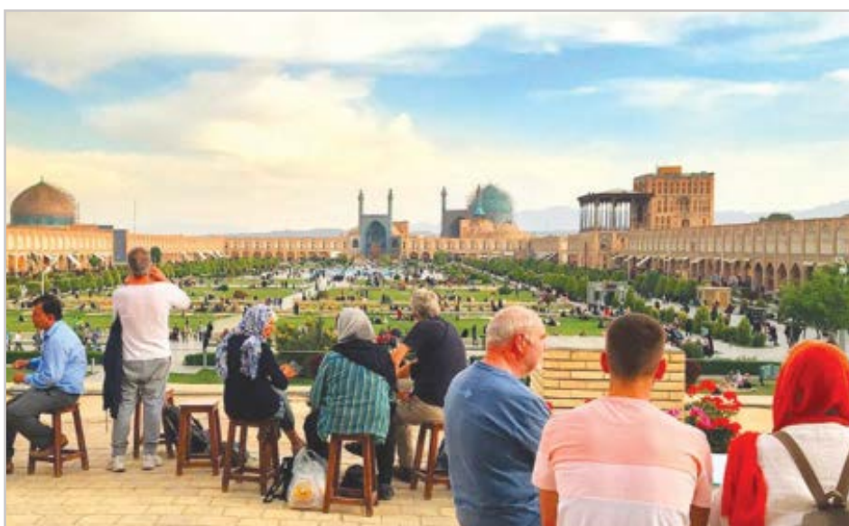
گروه شهری کورش

از نظرات شهروندان در چهار گام اصلی تدوین برنامه جامع اصفهان استفاده می شود