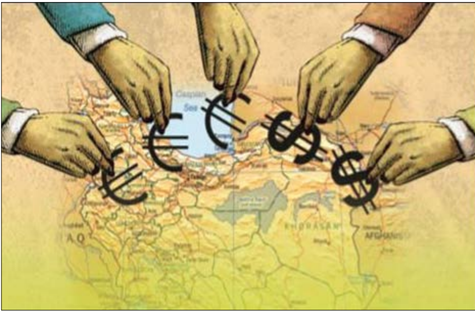
گروه اقتصاد بورس

استان اصفهان در کنار کرمانشاه، کرمان و آذربایجان غربی به‌طور مشترک در رتبه ششم جذب سرمایه گذاری خارجی قرار گرفت