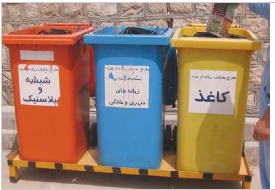
گروه شهری گزارش

شهرداری باید تسهیل گر ورود بخش خصوصی به عرصه مدیریت پسماند شود