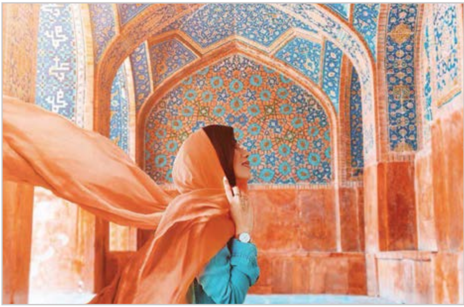
گروه شهری گزارش

عکاسی ناآگاهانه به گنجینه‌های ملی آسیب‌های جدی وارد می‌کند