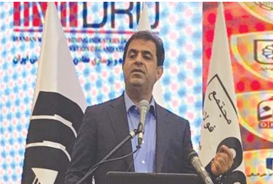
گروه صنعت گزارش

غریب پور: فولاد مبارکه با سرمایه گذاری در توسعه ها به دستاوردهای بزرگی رسیده است