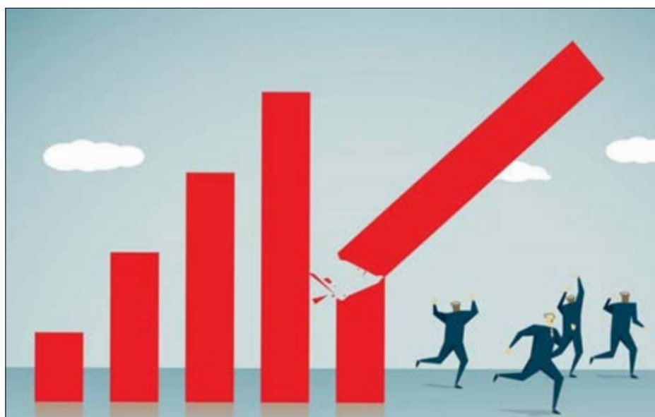
گروه اقتصاد نوشان

صاحب نظران پیش بینی می کنند، در سال آینده، با افزایش ثبات، امکان خروج از رکود اقتصادی فراهم می شود