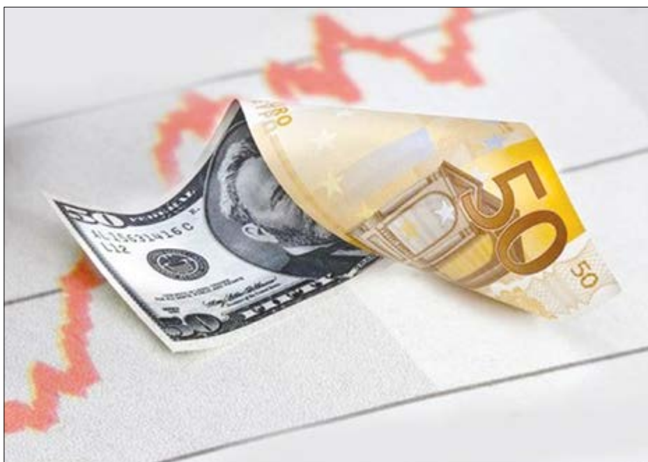
گروه بازار گانی هفته نامه نوسان

به نظر می‌رسد در میان همه بازارها، بازار سرمایه روزهای بهتری را سپری می‌کند