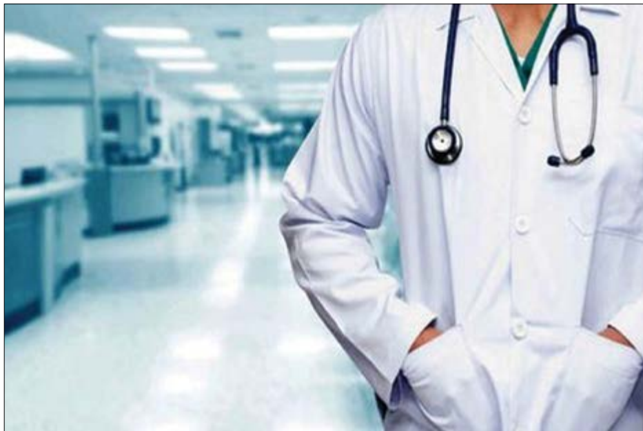
گروه شهری هفته نامه نوسان

کرونا در ایران از یک مسئله بهداشتی به یک مسئله سیاسی تبدیل شده است