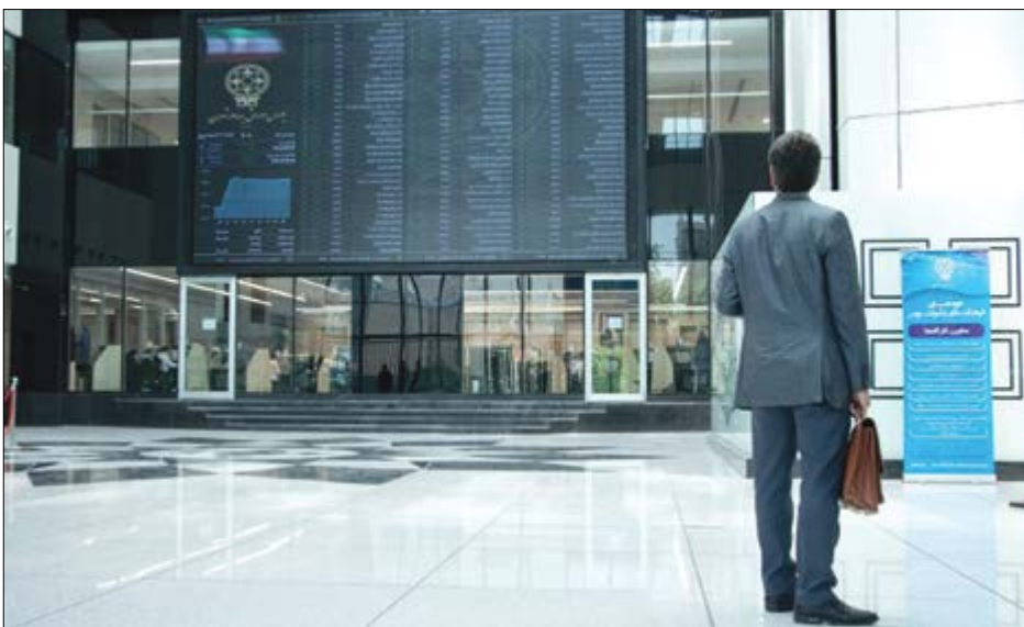
گروه بازارها کوالی

اهالی بازار سرمایه می گویند، دولت پس از دخالت در بازار آن را به حال خود رها کرده است