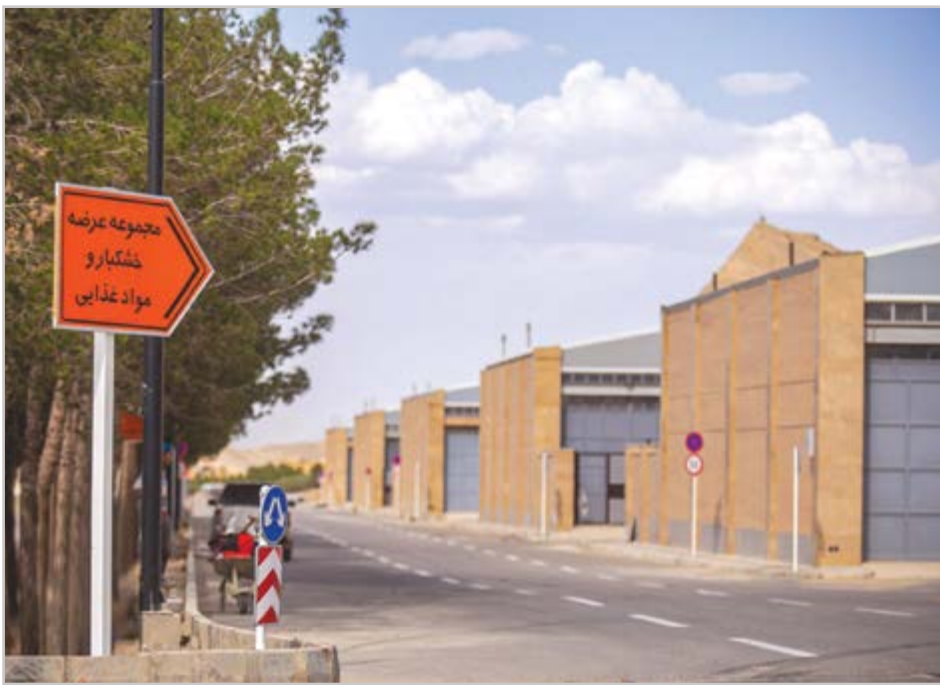
گروه شهری گزین

فاز نخست مجتمع صنفی عمده فروشان خوار و بار با صرف هزینه‌ای بالغ بر ۱۶۰ میلیارد تومان افتتاح شد