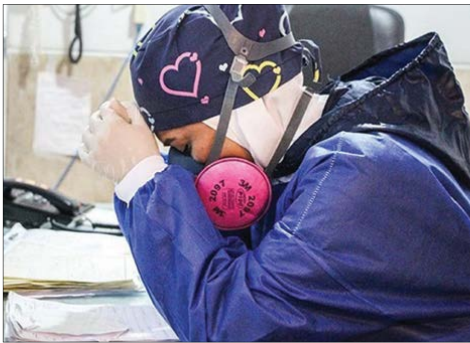
گروه سلامت گزارش

خشم فروخورده، اضطراب و افسردگی، مواردی شایع در میان دستیاران پزشکی هستند!