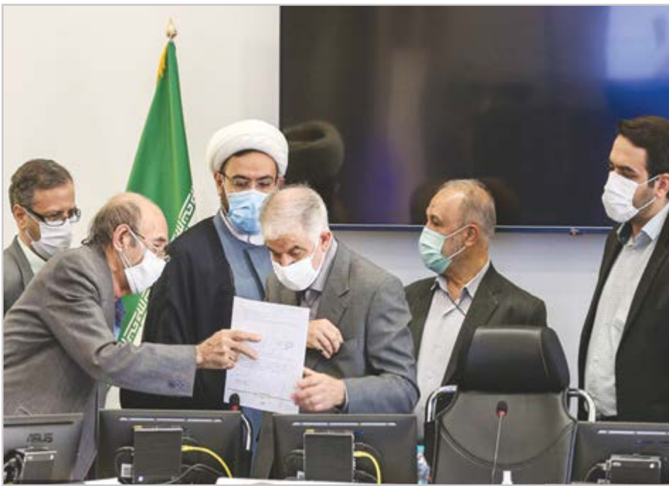
گروه شهری هفته نامه نوسان

ورود بی‌رویه نیروهای حزبی به بدنه اجرایی، باعث بروز بیماری عدم پاسخگویی در مدیریت شهری خواهد شد