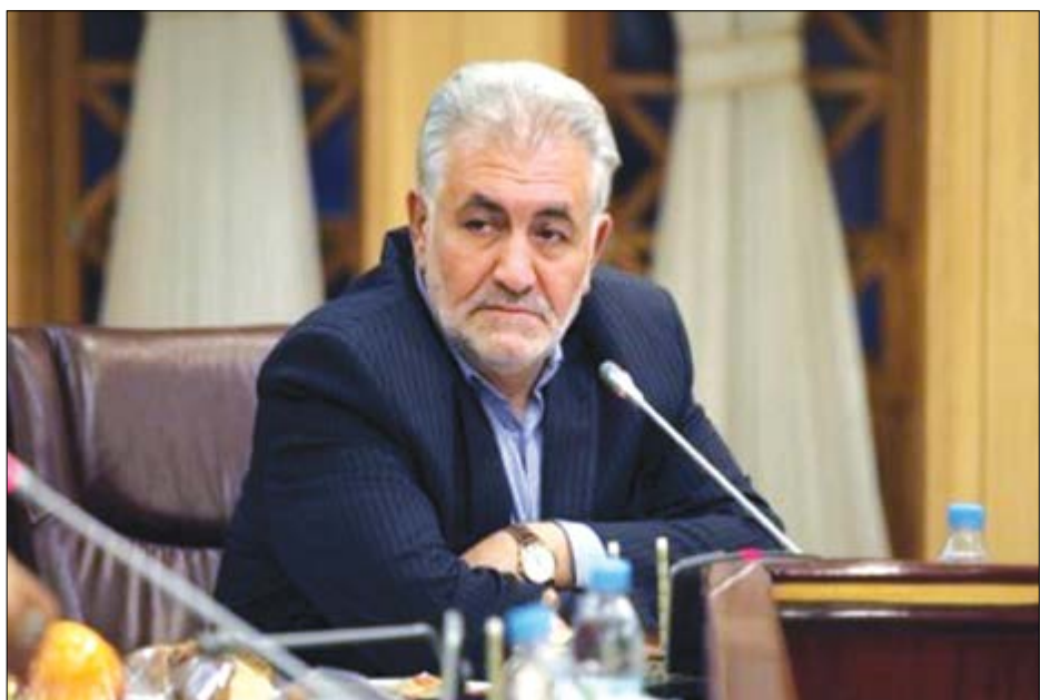
گروه صنعت هفته نامه نوسان

انجمن شن و ماسه استان متولی صدور مجوز، اصلاح و تسطیح معادن استان شد