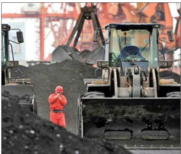
گروه صنعت گزارش

رشد قیمت سنگ آهن را رقابت مغرب می‌دانیم و باید برای آن تدبیری اندیشیده شود