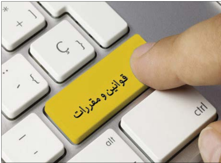
گروه بازارها گریزی

به گفته برخی از تحلیلگران حدود ۱۵۰۰ مجوز دولتی و حاکمیتی در خصوص کسب و کارها در ایران وجود دارد