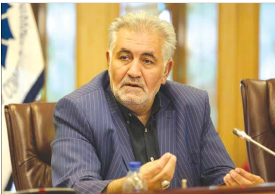
گروه صنعت گزارش

رئیس خانه صنعت، معدن و تجارت ایران و اصفهان در گفت‌وگو اختصاصی با "هفته‌نامه نوسان" به مناسبت هفته نکوداشت اصفهان، استان اصفهان را سرزمینی با قدمت دیرینه تاریخی و تمدن ایرانی و شهر اصفهان را محل زندگی ادیان مختلف در کنار هم با صلح و آرامش در طول قرن‌ها و زادگاه هنرمندان و صنعتگرانی شهریه توصیف کرد.