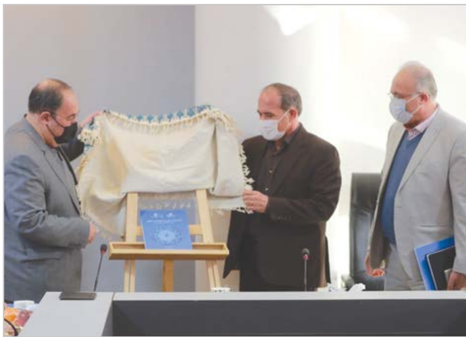
گروه شهری گزارش

دفتر ملی یونسکو و شهرداری اصفهان یکصد راهکار برای احیا و توسعه صنایع دستی اصفهان ارائه شد