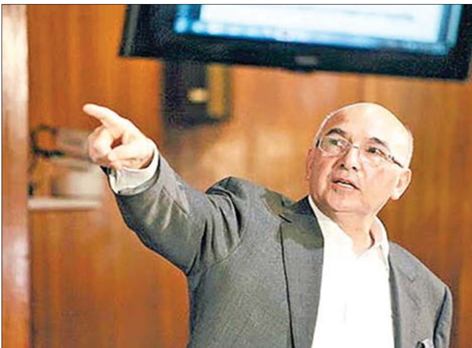
گروه بازرگانی گزارش

اقتصاد ایران در دوران پسا کرونا می تواند رشد مثبت ۳ درصدی را تجربه کند