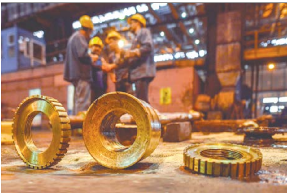
گروه صنعتی بزرگی

تمامی معادن سنگ آهن و زغال سنگ کشور به واسطه ذوب آهن و گاهی با هزینه این شرکت توسعه یافته‌اند