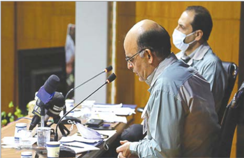
گروه صنعت فولاد مبارکه

امسال قصد داریم به رکورد ۷،۲ میلیون تن تولید در شرکت مادر گروه فولاد مبارکه دست یابیم