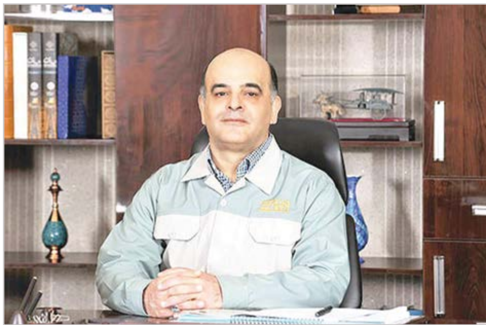
گروه صنعت گفت و گو

عظیمیان: تامین ارز با خام فروشی جز خسارت برای نسل حاضر و آینده سودی نخواهد داشت