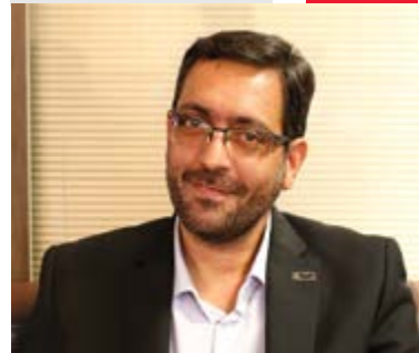
رویکرد دانش پژوهانه در فولاد مبارکه