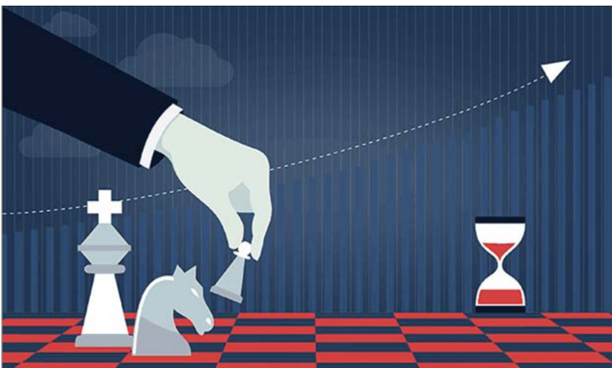
گروه اقتصاد هفته نامه نوسان

با وجود آثار مثبت کاهش نرخ بهره بین‌بانکی، اما واکنش بازار سرمایه مثبت نیست!