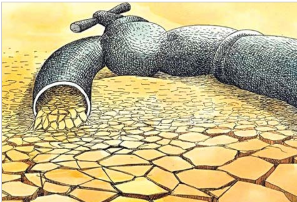
گروه شهری هفته نامه نوسان

کمیسیون آب و مناطق کم بر خوردار شورای اسلامی شهر اصفهان با موضوع «بررسی ظرفیت های متقابل بخش خصوصی و مدیریت شهری به منظور رفع مشکلات حوضه آبریز زاینده رود و بحران های زیست محیطی در استان و شهر اصفهان» به درخواست اتاق بازرگانی، صنایع، معادن، کشاورزی اصفهان برگزار شد. رئیس کمیسیون آب و مناطق کم بر خوردار شورای اسلامی شهر در این جلسه اظهار کرد: خوشبختانه همراهی نهادهای تصمیم ساز و تصمیم گیر شهر اصفهان را برای احقاق حق مردم در صحنه عمل شاهد هستیم.