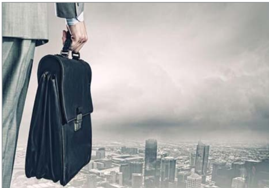
گروه شهری هفته نامه نوسان

کنار گذاشتن تنگ نظری ها و پذیرفتن حاکمیت خرد جمعی و شایسته سالاری تنها راه جلوگیری از مهاجرت نخبگان است