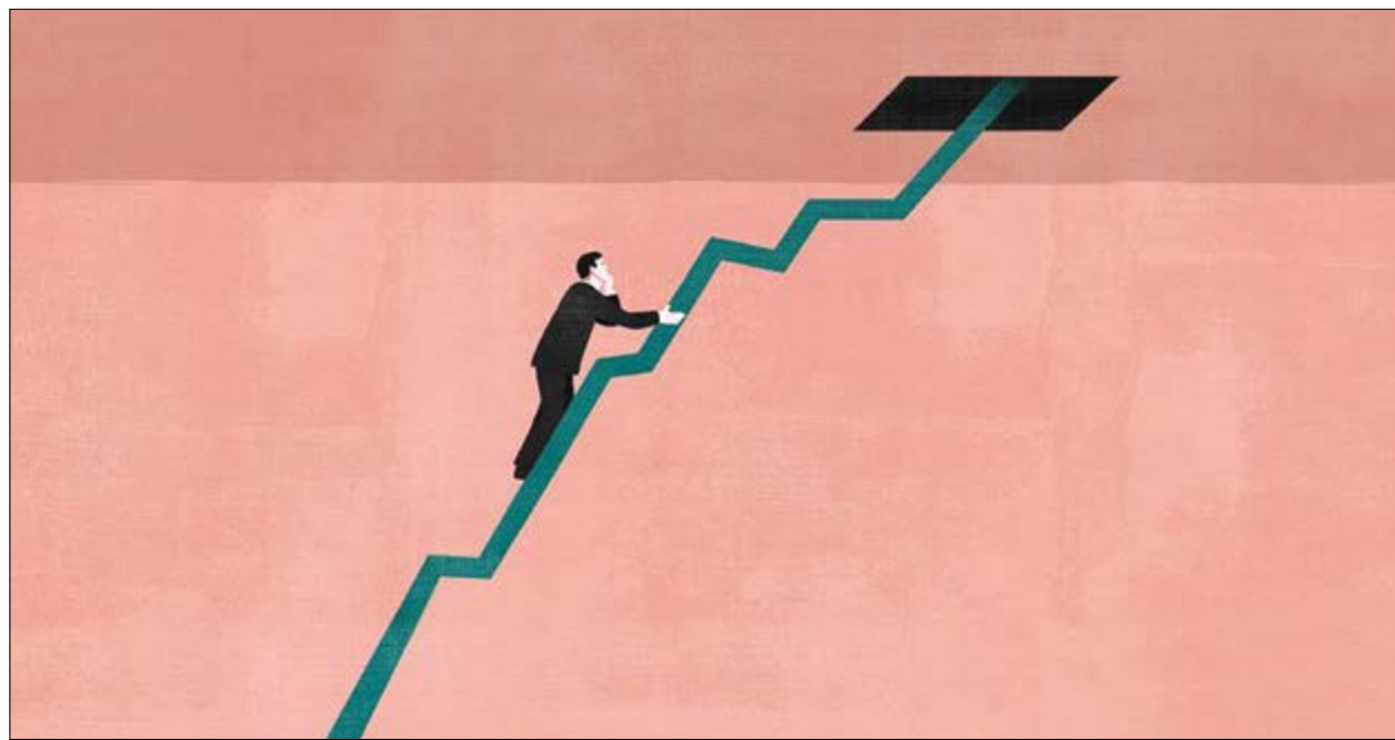
گروه اقتصاد هفته نامه نوسان

حجم بالای زبان انباشته شرکت‌های دولتی، تنه به تنه بودجه عمومی کشور می‌زند