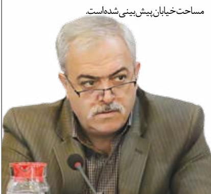
مساحت خیابان پیش بینی شده است.

وی با بیان اینکه مردم به مجموعه بازارهای روز کوثر اقبال نشان می دهند، گفت: در این بازارها کیفیت و قیمت مناسب حرف اول را می زند. همچنین ناظر بهداشتی و دامپزشکی در این فروشگاه ها مستقر است و نظارت کافی صورت می گیرد.