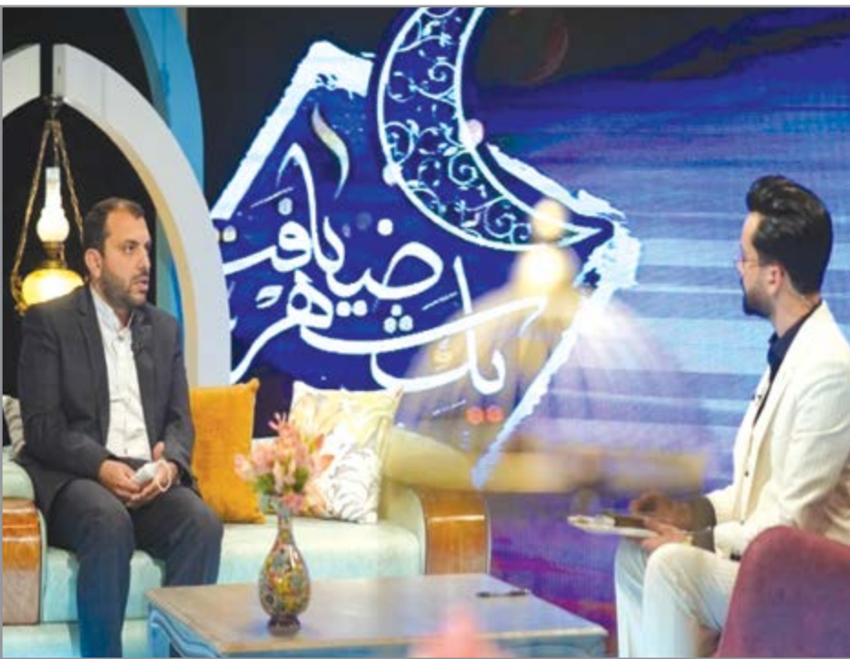
گروه صنعت گزارش

با کمک ۲۰ میلیارد ریالی فولاد مبارک، زمینه آزادی زندانیان محکوم مالی فراهم شد