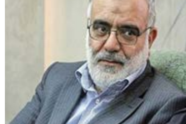
الکویی برای سایر صنایع

نوسان: رئیس کمیته امداد امام خمینی (ره) در مراسم امضای تفاهم‌نامه همکاری میان کمیته امداد و شرکت فولاد مبارکه گفت: این اقدام فولاد مبارکه باید برای استان‌های دیگر و صنایع کشور الگو باشد.