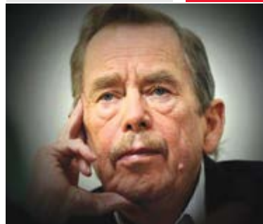
واتسلاو هاول / برگردان: فرناز سیفی