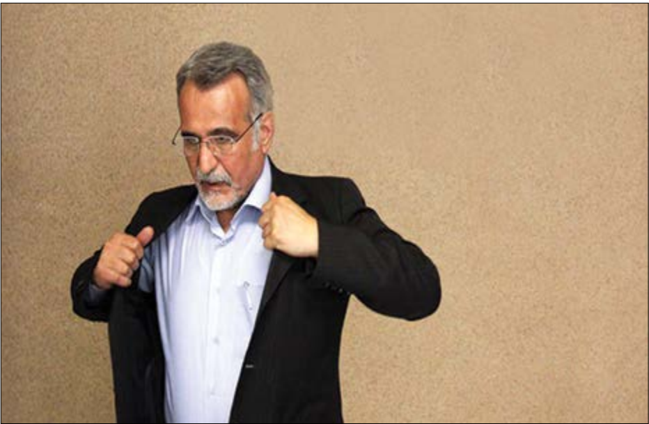
گروه شهری و کوارتی

خرم: صنعت ساختمان ایران سه نسل از دنیا عقب است