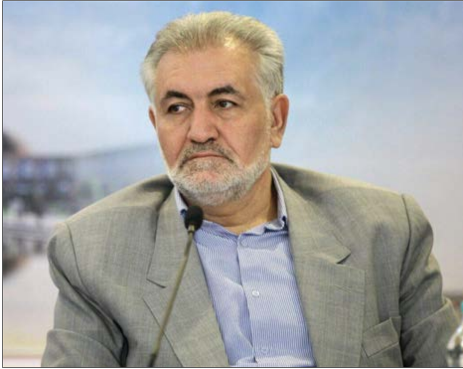
گروه شهری گزارش

افزایش چندمرحله ای نرخ حمل بار، تهدیدی برای فعالان سنگ و معدن است