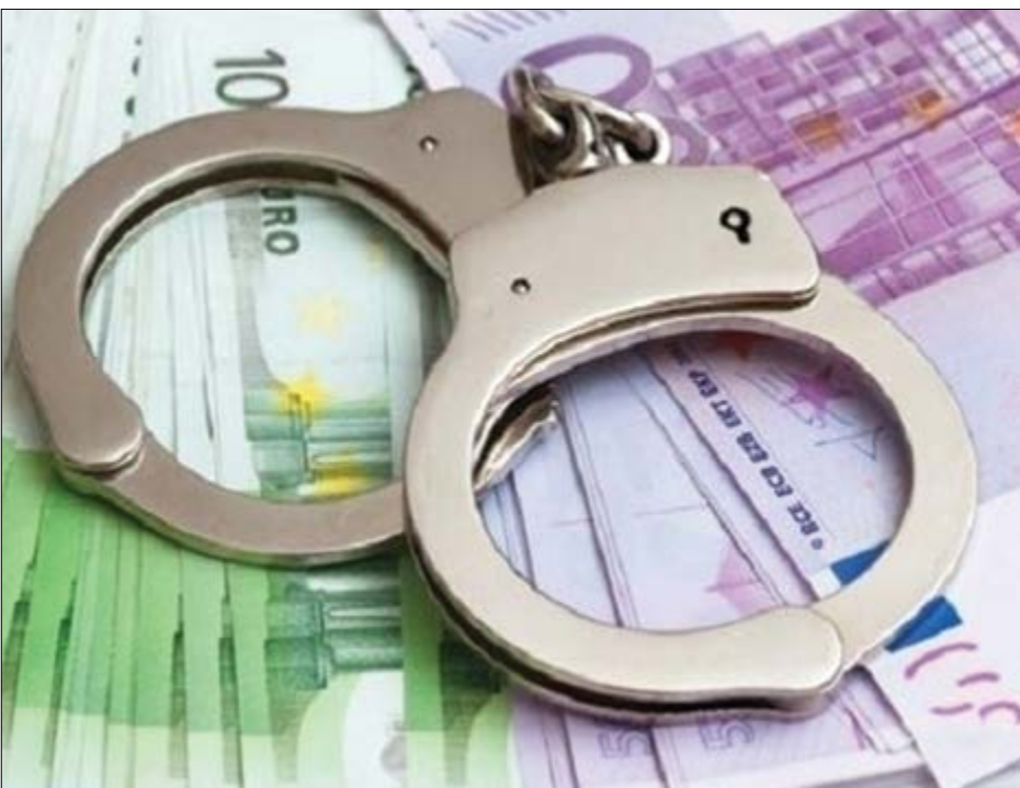
گروه اندیشه گزافش

روش مبارزه با فساد اقتصادی نقض هایی دارد که اگر برطرف نشوند، همه شعارها به ضد خود تبدیل می شوند