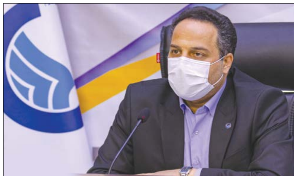
گروه اقتصاد گزارش

مدیرعامل شرکت آب و فاضلاب استان اصفهان با بیان اینکه در ۶ ماهه اول سال جاری