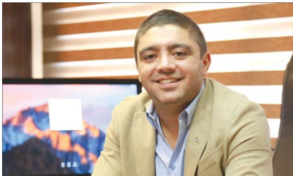
گروه بازرگانی گمک و گو