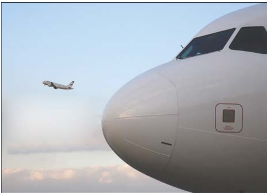
گروه بازرگانی گزارش

طی هفت ماه گذشته ۲۴۵۰ تن بار به ارزش ۱۰ میلیون دلار از کارگوترمینال اصفهان صادر شده است